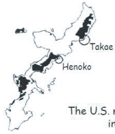
The U.S. military facilities in Okinawa